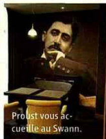
Proust vous accueille au Swann.

Package champagne et massage à 380 € pour deux personnes, comprenant une nuit en chambre Deluxe, un cocktail champagne au bar Le V, le petit déjeuner gourmand, un massage bien-être « Villa Maillot » (durée 1 heure), l'accès au spa et le code wifi offert. Valable du 14 décembre au 28 février. www.lavillamaillot.fr , Code FEMACTU .