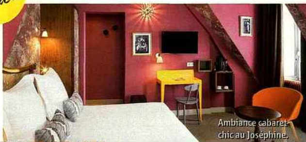
Ambiance cabaret chic au Josephine.