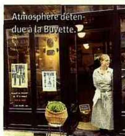
Atmosphère détendue à la Buvette.

290 € TTC pour deux comprenant 2 nuits en chambre double + petit déjeuner + 1 bouteille de champagne offerte. Valable du 9 décembre au 24 janvier, hors nuits du 31 décembre au 2 janvier.