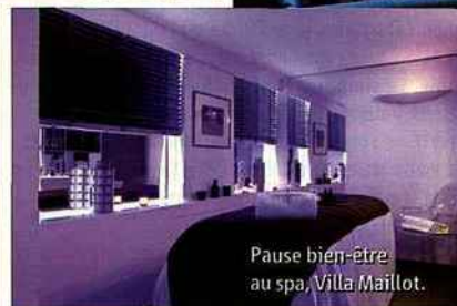
Pause bien-être au spa, Villa Maillot.

Pour toute réservation entre le 9 décembre et le 31 mars, l'hôtel Le Swann offrira aux lectrices les petits déjeuners ainsi qu'une œuvre proustienne surprise. Ch. à partir de 159 €. Réservation@hotelswann.com , code: Femme Actuelle .