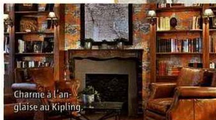
Charme à l'anglaise au Kipling.

Package cocooning à 299 € pour deux personnes, comprenant une nuit dans une chambre créée par Olivier Lapidus, 2 petits déjeuners, 1 massage d'une heure avec 1 thé détox et petite douceur macarons. Valable du 9 décembre 2013 au 27 mars 2014 hors périodes de salons. www.hotelfelicienparis.com , code: actufelicien . Tél. : 01 55 74 00.