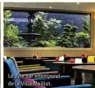
Le V, le bar intemporel de la Villa Maillot.