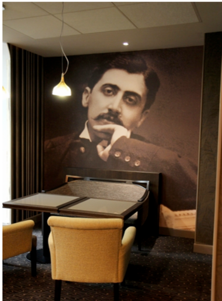
L'un des salons de l'hôtel

Un hôtel très littéraire, imprégné de l'univers de Proust - 1 er épisode -